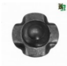
Декоративный колпачок, арт. 8.929 д=45x1,5мм Вес: 0.018 кг Цена: 16 руб.