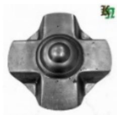
Декоративный колпачок, арт. 8.920 д=120x1,5мм Вес: 0.14 кг Цена: 60 руб.