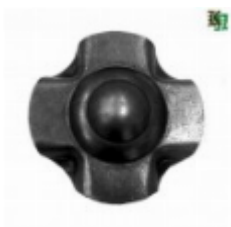
Декоративный колпачок, арт. 8.924 д=45x1,5мм Вес: 0.02 кг Цена: 21 руб.