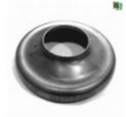
Переходник на трубу, арт. 8.15976