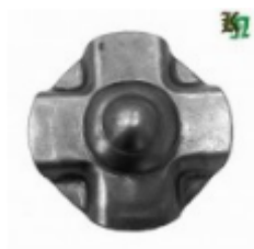
Декоративный колпачок, арт. 8.925 д=45x1,5мм Вес: 0.02 кг Цена: 17 руб.