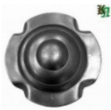
Декоративный колпачок, арт. 8.927 д=54x1,5мм Вес: 0.03 кг Цена: 20 руб.