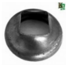
Переходник на трубу, арт. 8.764040 д=76мм, переход на кв.40x40 Вес: 0.23 кг Цена: 115 руб.