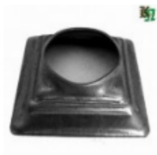
Переходник на трубу, арт. 8.808042 кв.80x80мм, переход на д=42x2мм Вес: 0.11 кг Цена: 59 руб.