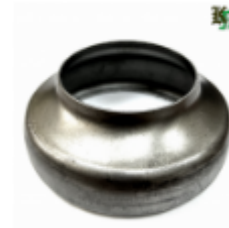
Переходник на трубу, арт. 8.10876