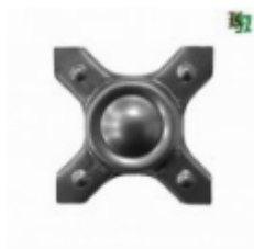
Декоративный колпачок, арт. 1911.36 65x65мм, д=35мм, под трубу 10x10мм Вес: 0.02 кг Цена: 19 руб.