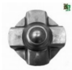
Декоративный колпачок, арт. 8.922 д=75x1,5мм Вес: 0.06 кг Цена: 20 руб.