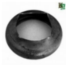
Переходник на трубу, арт. 8.1026060 д=102мм, переход на кв.60x60мм Вес: 0.31 кг Цена: 150 руб.