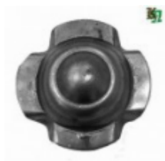
Декоративный колпачок, арт. 8.928 д=54x1,5мм Вес: 0.03 кг Цена: 20,50 руб.