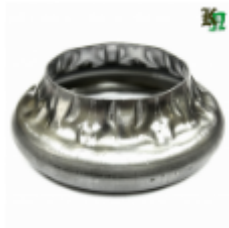
Переходник на трубу, арт. 8.883