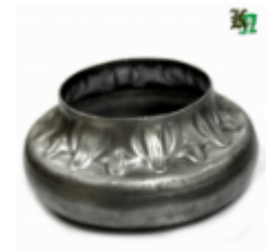
Переходник на трубу, арт. 8.877