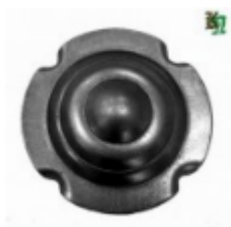
Декоративный колпачок, арт. 8.926 д=78x1,5мм Вес: 0.06 кг Цена: 25,50 руб.