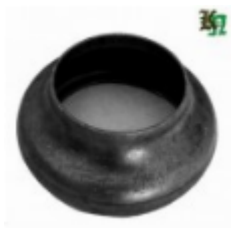
Переходник на трубу, арт. 8.7657 д=76мм, переход на д=57мм Вес: 0.23 кг Цена: 109 руб.