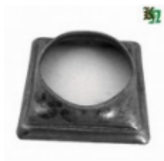
Переходник на трубу, арт. 8.606042 кв.60x60мм, переход на д=42x2мм Вес: 0.04 кг Цена: 44 руб.