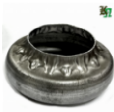
Переходник на трубу, арт. 8.878 д=76мм, переход на д=57мм Вес: 0.15 кг Цена (за шт): 123 руб.