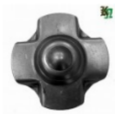
Декоративный колпачок, арт. 8.921 д=78x1,5мм Вес: 0.06 кг Цена: 30 руб.