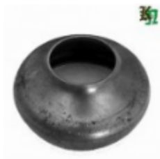
Переходник на трубу, арт. 8.7642 д=76мм, переход на д=42мм Вес: 0.23 кг Цена: 110 руб.