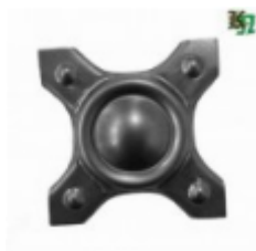
Декоративный колпачок, арт. 1910.36 90x90мм, д=45мм, под трубу 15x15мм Вес: 0.04 кг Цена: 19,90 руб.